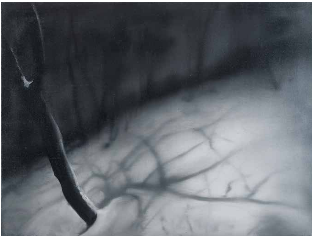
Наталія ЛІСОВА Із серії «Тихий простір» Полотно, олія, 60x80 см, 2024