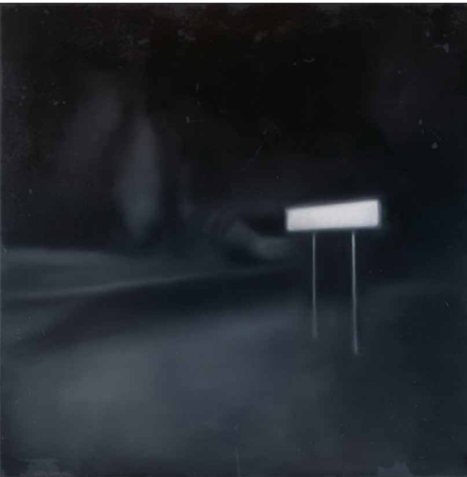
Наталія ЛІСОВА Із серії «Тихий простір» Полотно, олія, 100x100 см, 2024