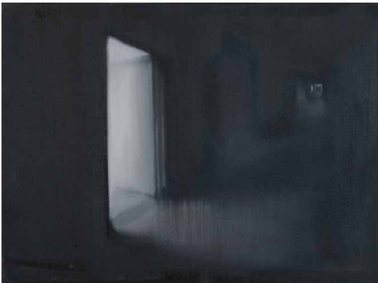
Наталія ЛІСОВА Із серії «Тихий простір» Полотно, олія, 45x60 см, 2024