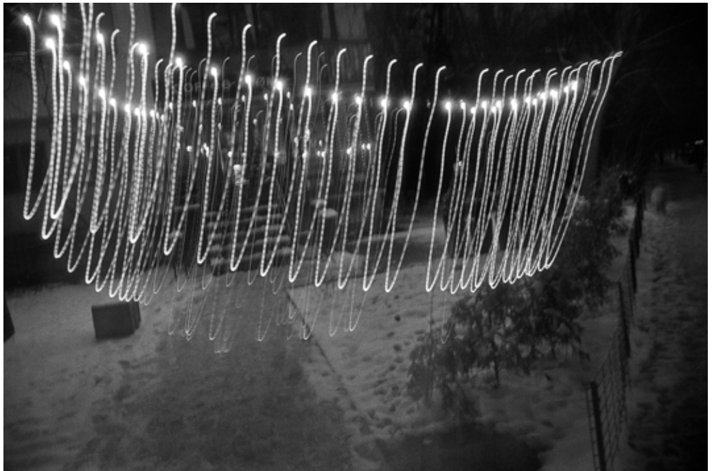
Олег МАЛОВ Без назви #7 2024, цифровий друк, 60x90, 1/5