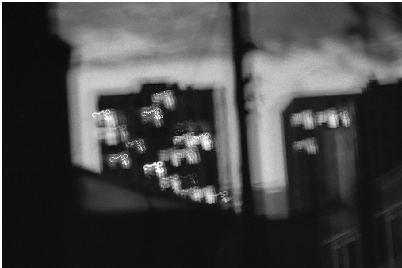
Олег МАЛОВ Без назви #13 2024, цифровий друк, 60x90, 1/5