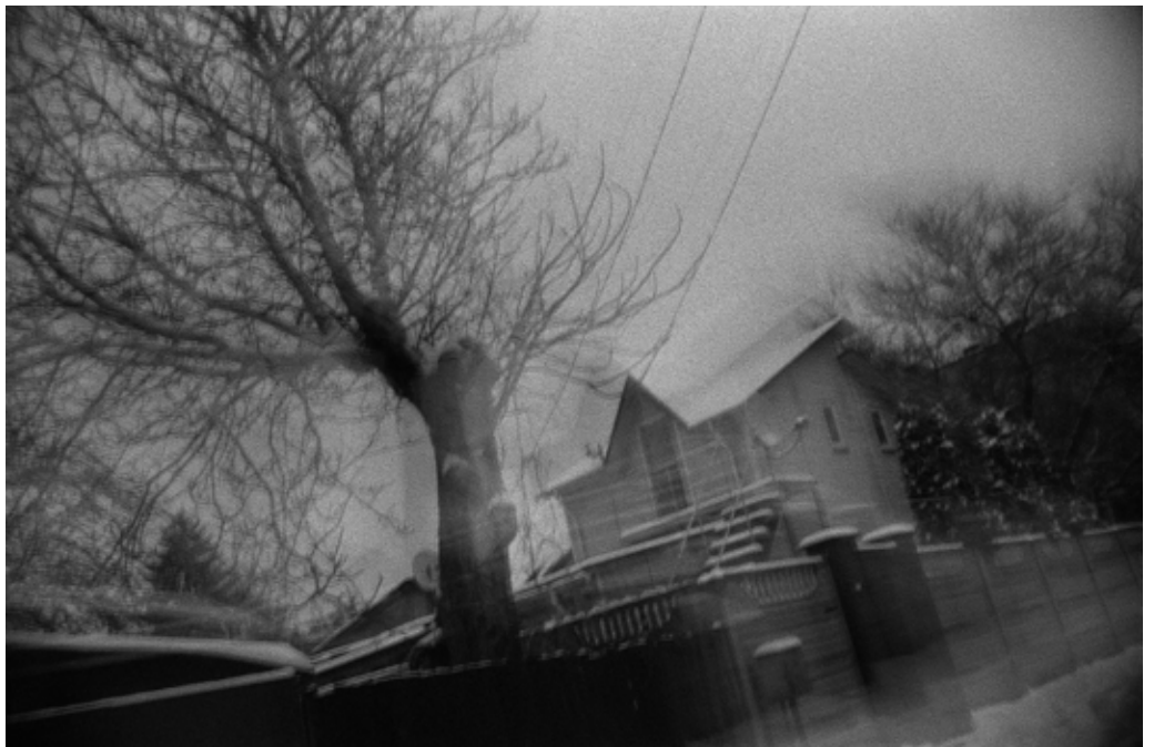
Олег МАЛОВ Без назви #11 2024, цифровий друк, 60x90, 1/5