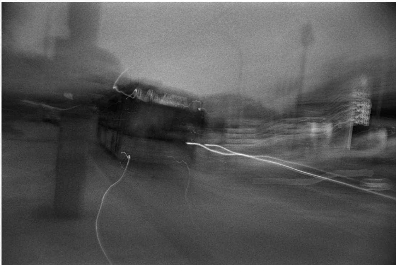
Олег МАЛОВ Без назви #5 2024, цифровий друк, 60x90, 1/5