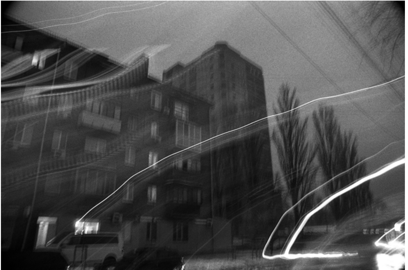
Олег МАЛОВ Без назви #19 2024, цифровий друк, 60x90, 1/5