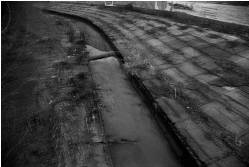
Олег МАЛОВ Без назви #23 2024, цифровий друк, 60x90, 1/5