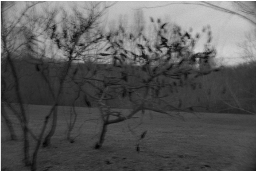
Олег МАЛОВ Без назви #31, 2024, цифровий друк, 40x60, 1/5