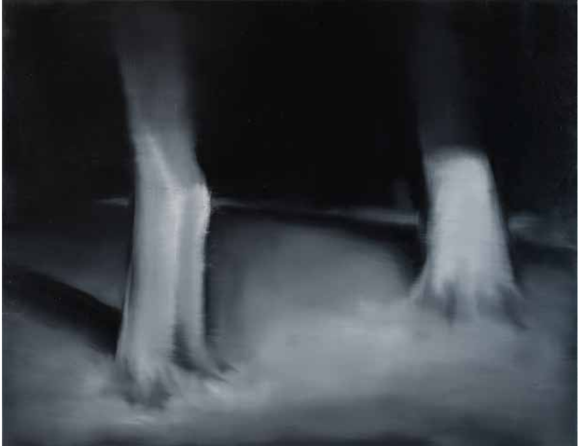
Наталія ЛІСОВА Із серії «Тихий простір» Полотно, олія, 70х90 см, 2024