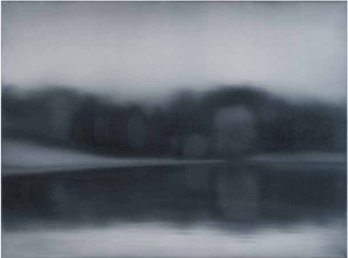
Наталія ЛІСОВА Із серії «Тихий простір» Полотно, олія, 45x60 см, 2024